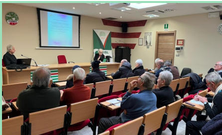
La riunione organizzata dai pensionati Cisl della zona di Cuneo sul tema del mercato libero di luce e gas lo scorso 14 dicembre

Da mercoledì 10 gennaio i clienti del gas ancora legati al mercato a maggior tutela devono obbligatoriamente passare al mercato libero. Questo passaggio obbligatorio non riguarda i clienti considerati vulnerabili e dunque: soggetti con disabilità con legge 104; chi ha età superiore ai 75 anni; chi percepisce un bonus e dunque ha una condizione economica svantaggiata. Queste tre categorie possono restare nel mercato tutelato. Per